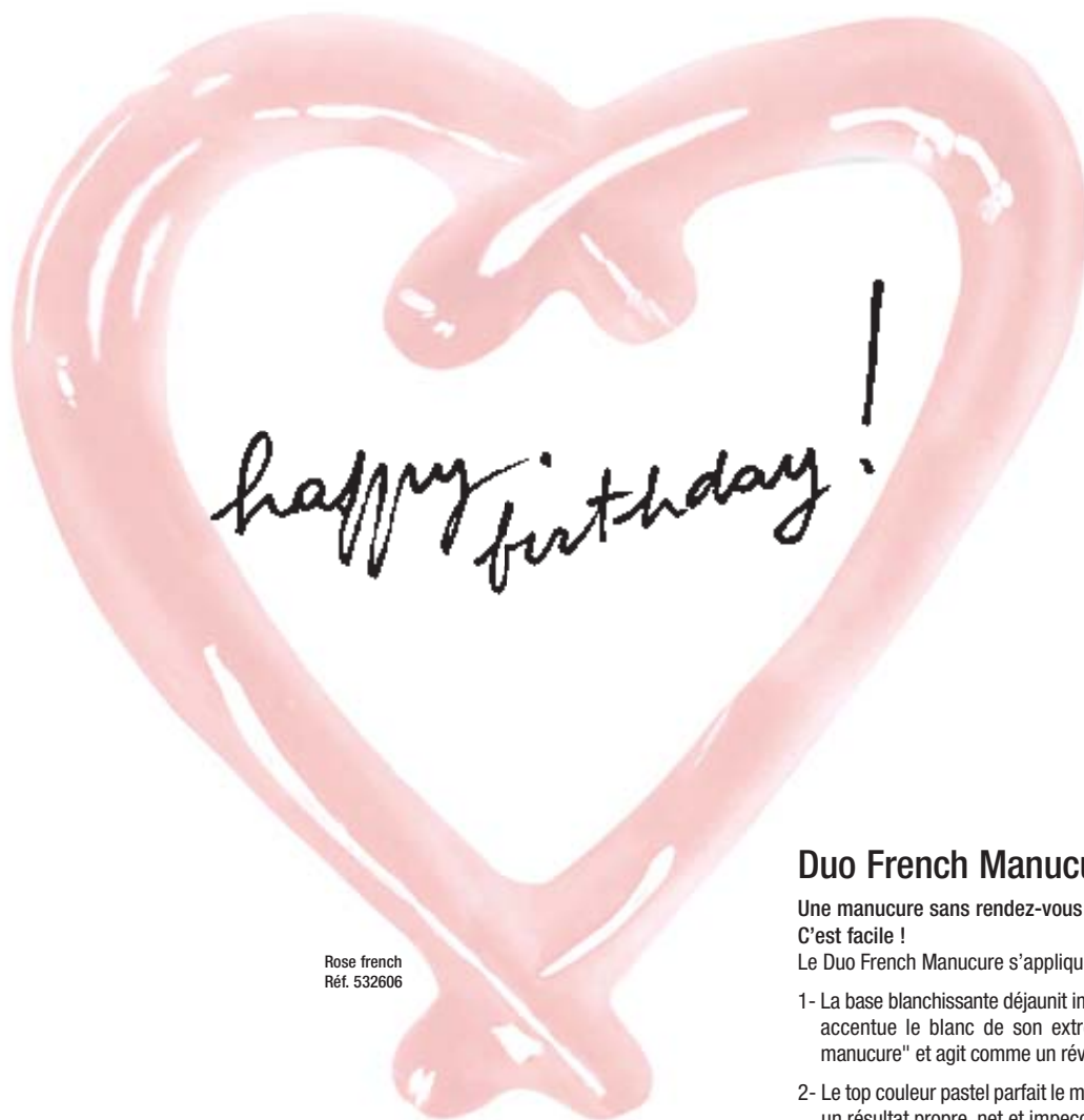
Rose french Réf. 532606

L'INDISPENSABLE DUO FRENCH MANUCURE : VOUS AVEZ ADORÉ !