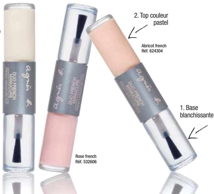
Rose french Réf. 532606